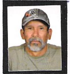
FOTO DEL SOLICITANTE

(DIRECCIÓN DE REGLAMENTOS FISCALIZACIÓN Y CONTROL.)